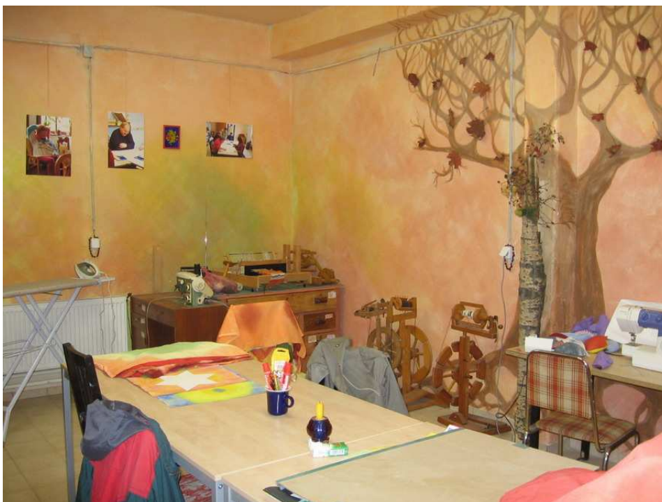
Obr.6 Výtvarná a textilní dílna v Camphillu (foto autor)