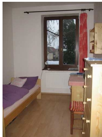
Obr4 Klientský pokoj v hlavní budově

byl v návrhu spíše oživen původní vesnický charakter zástavby celého statku s pravidelnými sedlovými střechami na domech, situovaných po obvodu dvora. Hlavní statek je využit pro bydlení rodin, pro dílny a pracovny, v zachované jídelně bude zřízen sál komunitního centra. K tomuto pozemku je ještě k dispozici další pozemek o dva statky blíže k nedaleko tekoucímu Labi, na kterém by měla stát část farmy s využitím přilehlých ploch pro zelenářskou zahradu.