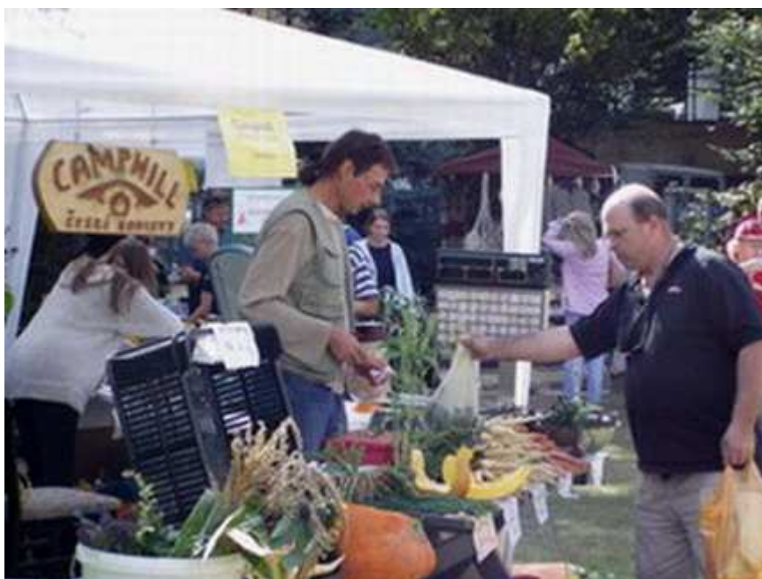
Obr.3 Prezentace Camphillu na výstavě Zahrada Čech

Camphillské komunity nejsou zatím v naší republice obecně známým pojmem, bude jistě trvat dalších několik let, než se tak stane. Proto se zakladatelé velmi snaží zveřejnit co největší množství informací o činnosti komunity. Zřídili k tomu účelu velmi dobře vedené a pravidelně aktualizované internetové stránky na adrese www.camphill.cz . Zde se zájemce dočte všechny potřebné informace jak o fungování camphillu, tak o poskytování služeb, financování, členech občanského sdružení a různých akcích, které camphill pořádá.