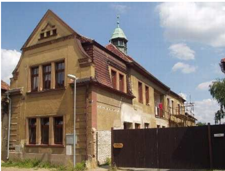
Obr.1 Hlavní obytná budova Camphillu během rekonstrukce

V květnu 2001 byla vypracována architektonická studie a stavební projekt na rekonstrukci usedlosti. O rok později byla rekonstrukce zahájena. Bohužel v srpnu 2002 byly objekty postiženy povodní (voda vystoupila do výše 1,7 m) a zničila vše, co se v jejím dosahu nacházelo, zanechala za sebou vrstvu bahna a vodou nasáklé zdivo. Následky povodně byly odstraňovány na podzim 2002 a na jaře 2003 za pomoci dobrovolníků - odklízeli poškozené věci, sušili a umývali, čistili a desinfikovali, osekávali omítku a vysoušeli zdivo.