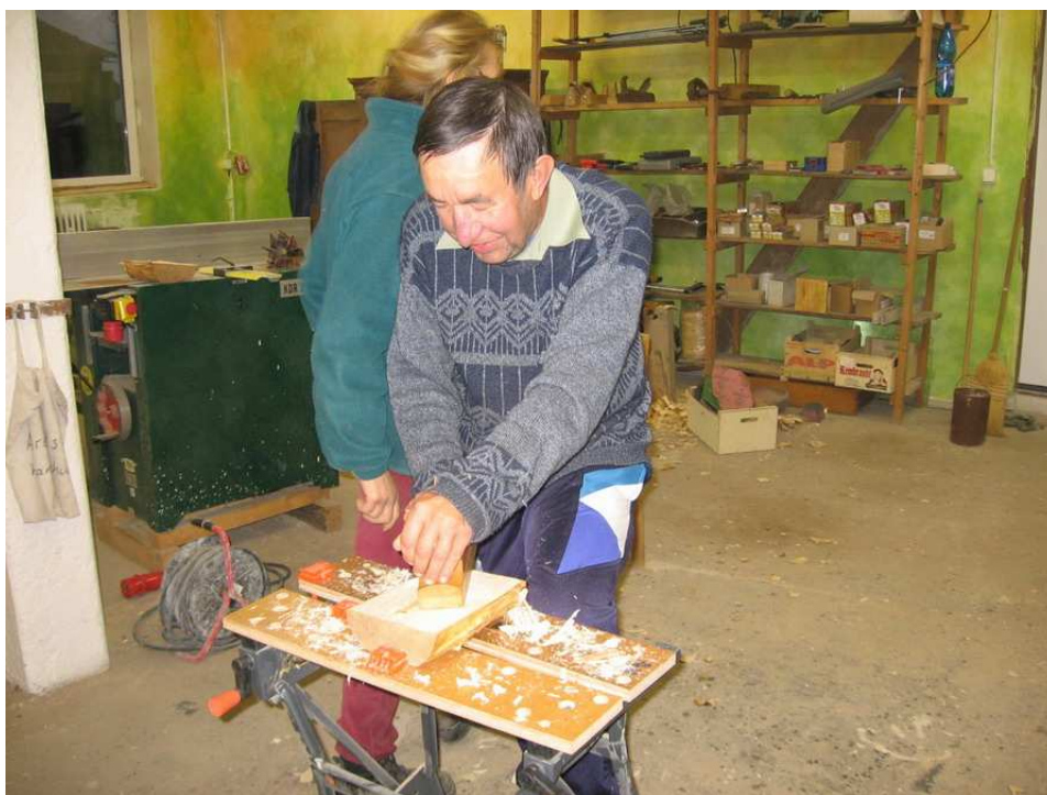
Obr.2 Klient Camphillu při práci v truhlářské dílně (foto autor)

V současné době poskytuje camphill služby v denním stacionáři, který byl otevřen v lednu 2004. Do stacionáře dojíždějí 3 – 4 klienti na několik dní v týdnu. Zapojují se do programu pracovní a sociální rehabilitace, zejména v textilní dílně, kde za pomoci vedoucí dílny tkají a šijí polštářky a plní je pohankovými slupkami, vyrábí tašky nebo malují na hedvábí, sklo nebo květináče. Příležitostně se zapojují do prací v zahradnictví a podílí se na přípravě jídla. Kromě toho je jim po dohodě s rodiči poskytována výuka některých základních znalostí a dovedností a také hodiny arteterapie. Součástí pobytu jsou i volnočasové aktivity. 20